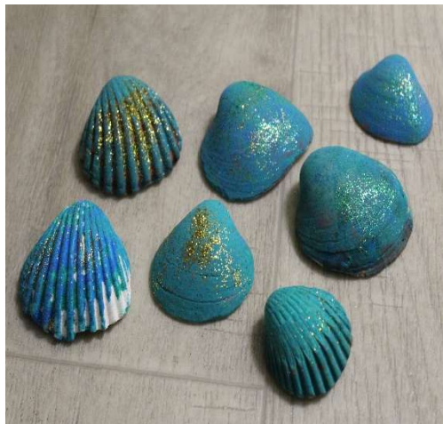
Temática: Playa Trabajamos con elementos naturales