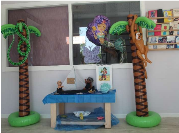
Temática: Sirenas y Piratas -Decoramos la escuela

Está comprobado que la clave para que se dé un aprendizaje real y duradero en el tiempo es que haya EMOCIÓN en el proceso. Cada semana de Summer Camp girará en torno a una unidad didáctica diferente, y atractiva para los niños y niñas. Todas las temáticas están relacionadas con el verano y las vacaciones . Durante la semana, decoramos la escuela y crearemos diferentes realidades para que los niños y niñas se impliquen en las actividades de forma activa y vivan en inglés .