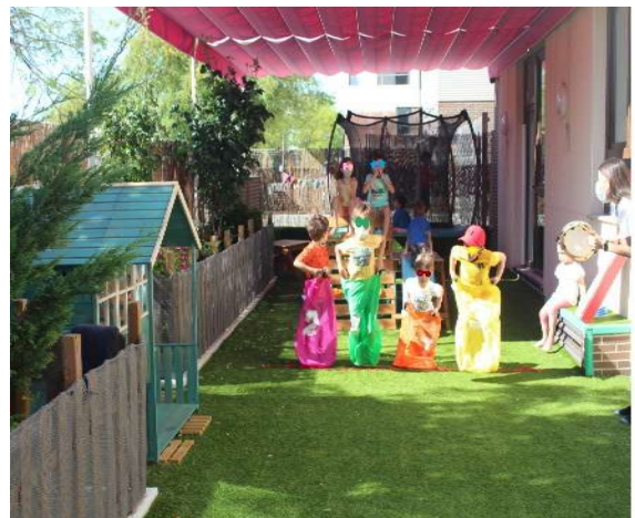
Espacios y tiempos dedicados el ocio, juego y tiempo libre . Carrera de sacos