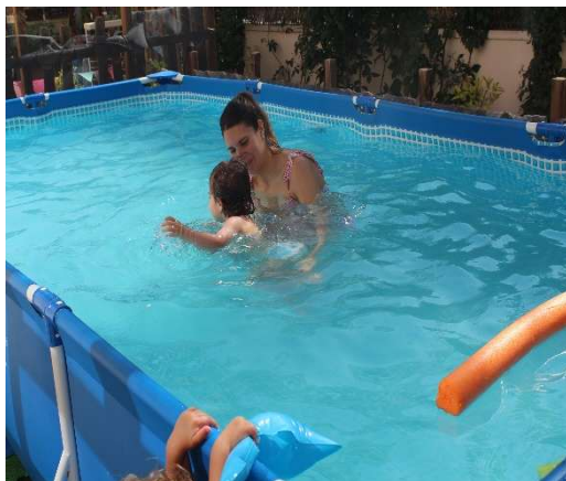
Juegos de agua . La importancia de disfrutar del verano en el exterior.