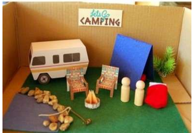
Temática: Let's go camping Creamos maquetas